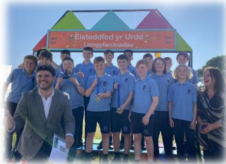
Côr Bechgyn Iau