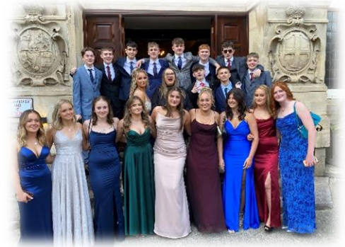
Dawns Ffarwel BI11 Gorffennaf 2022

Roeddem yn falch iawn o ymuno ag ysgolion cyfrwng Cymraeg eraill yn Ne Cymru mewn diwrnod HMS a oedd yn canolbwyntio ar rannu arfer da yn CA4. Ymunodd staff Glantaf â chydweithwyr o dros 20 o ysgolion mewn hyfforddiant dan arweiniad bwrdd arholi CBAC ym mhob pwnc. Roedd yr hyfforddiant hwn yn cynnwys dadansoddi perfformiad arholiadau yn ogystal â darparu cyfleoedd i adrannau rannu arfer da mewn addysgu a dysgu.