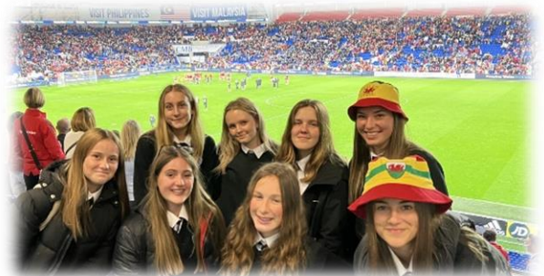
Cefnogi Tîm Pêl-droed Merched Cymru yng Ngemau Rhagbrofol Cwpan y Byd

Yn dilyn ymgynghoriad ar gynyddu ein cefnogaeth arbenigol yng Nglantaf i gynnwys Canolfan Awtistiaeth, mae trafodaethau'n parhau wrth i ni geisio gwireddu'r buddsoddiad sylweddol hwn erbyn mis Medi 2025. Byddai ei fuddsoddiad yn gartref newydd i Ganolfan Glantaf mewn canolfan modern, 21ain Ganrif a fyddai'n welliant enfawr ar ein lleoliad a'n hadnoddau presennol.