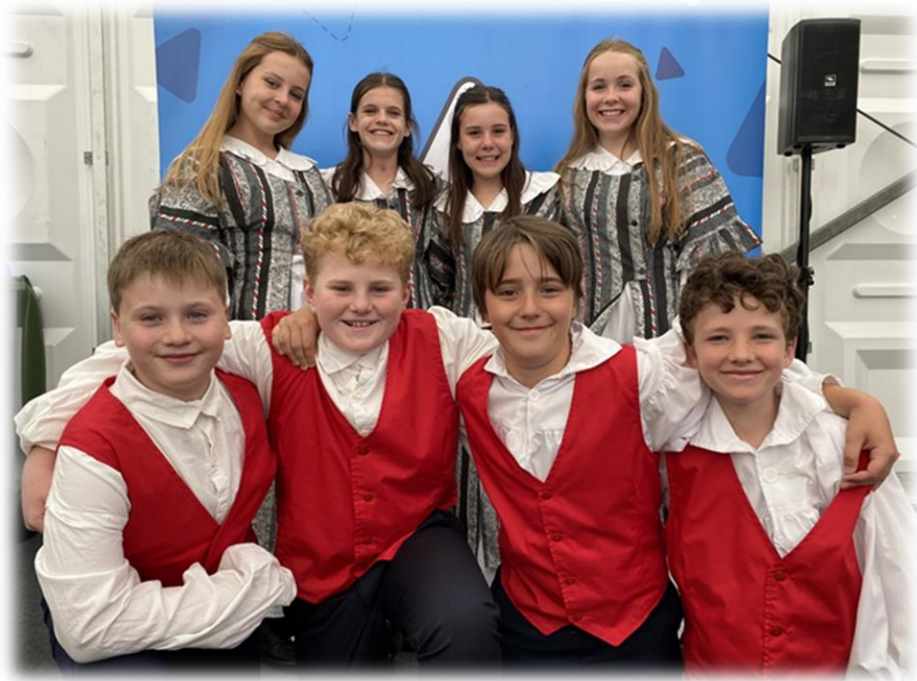
Grwp dawnsio gwerin bl 7, Llanyddyfri 2023