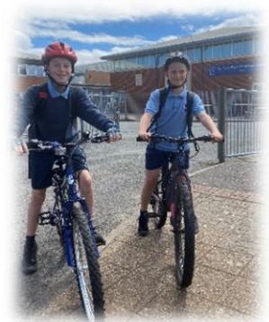
Seiclo Diogel i Glantaf

Yn ystod y flwyddyn ddiwethaf, roedd Glantaf yn parhau fel Ysgol Bartner gyda Llwybr Hyfforddi Athrawon Rhan Amser y Brifysgol Agored, yn ogystal â chael ei derbyn fel Ysgol Bartner Llywodraeth Cymru ar grant Llwybr Pontio Cynradd > Uwchradd i athrawon. Roedd hyn yn golygu bod pedwar aelod o staff o fewn pynciau craidd wedi hyfforddi ar y cynlluniau rhain gyda ni yng Nglantaf yn ystod y flwyddyn ddiwethaf. Mae'r cyrsiau hyfforddi hyn a ariennir yn llawn yn