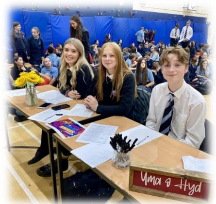
Gwyl Shwmai Su'mae 2022

Ysgol Gyfun Gymraeg yng Nghyngor Dinas a Bwrdeistref Sirol Caerdydd yw Ysgol Gyfun Gymraeg Glantaf. Cynigir y cwricwlwm drwy'r ysgol yn gyfan gwbl yn y Gymraeg yn CA3, CA4 ac yn CA5.