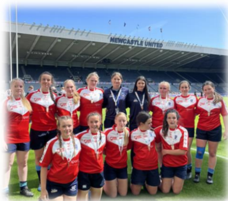
Medalau Arian Tîm Glantaf dan 15 Rownd Derfynol Rygbi'r Gynghrair Prydain