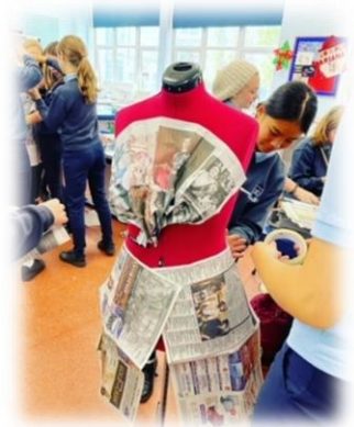
D&T Her Ailgylchu gyda Bl 9

Roeddem yn falch iawn o groesawu ymwelwyr a sefydliadau partner i'r ysgol a oedd yn cynnwys: