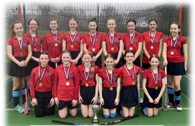
Pencampwyr Hoci Sirol B17