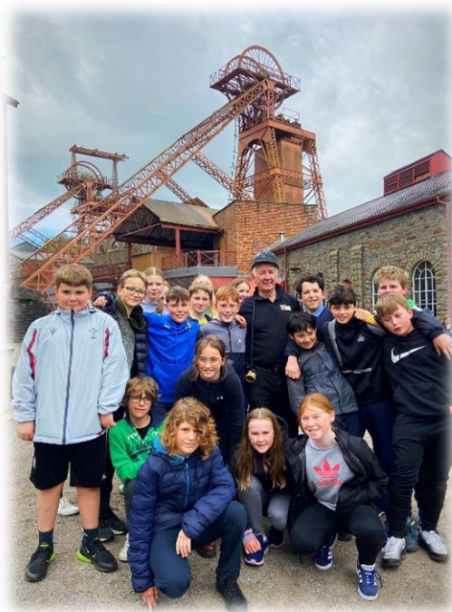
Taith Bl 7 Coron Gwlad i Barc Treftadaeth y Rhondda