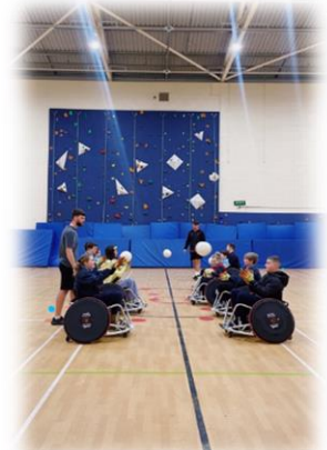
Sesiwn rygbi cadair olwyn gyda Rygbi Caerdydd