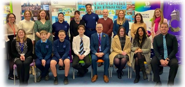
Fforwm Busnes Glantaf 2022-23

Mae ein awdit ysgol gyfan diweddar i faes Iles, wedi dwyn ynghyd farn ein holl randdeiliaid ac yn sail i'n gwelliannau yn y maes hwn. Rydym wedi symud i lwyfan cyfathrebu newydd i ddisgyblion a rhieni Classcharts , sy'n caniatáu i ni hybu ein systemau clod a chanmol i annog disgyblion i ddysgu, a lleihau camau negyddol. Rydym wedi cyflwyno cwricwlwm Ilesiant newydd ers blwyddyn, ac eleni wedi ei werthuso a'i adolygu er mwyn sicrhau ei berthnasedd a'i werth i ddisgyblion. Yn olaf, mae ein hadolygiad staffio wedi ein galluogi i ymestyn ein timau bugeiliol i gynnwys Dirprwy Gynnydd a Lles i hybu capasiti arwain yn ogystal âg Anogwr Dysgu arbennig ar gyfer CA5. Byddwn yn gwreiddio'r strwythurau staffio newydd hyn yn effeithiol yn ystod 2023/24.