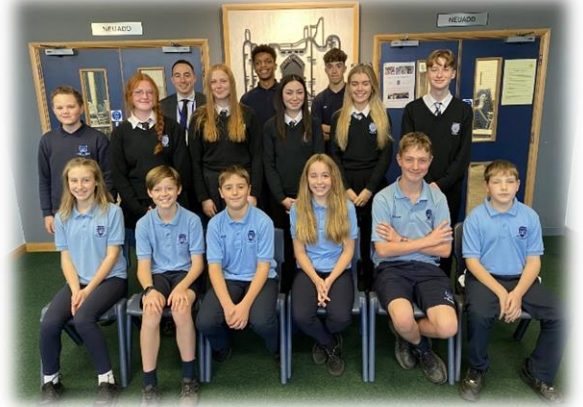
Senedd yr Ysgol 2022-23

Rydym yn parhau ein gwaith â disgyblion a staff o Ysgol Uwchradd Llanwern ar gydraddoldeb ac amrywiaeth. Mae ein trafodaethau wedi sbarduno llawer o fentrau newydd, o newid testunau gosod (newid i " I know why the caged bird signs "), i gynnwys mwy o enghreifftiau o amrywiaeth o fewn hanes a diwylliant Cymru. Mae myfyrwyr o Glantaf wedi gweithio i ddatblygu fideo hyrwyddo ar gyfer recriwtio athrawon o gefndiroedd ethnig i ymuno â'r proffesiwn. Lanswyd hyn gan y Gweinidog Addysg, Jeremy Miles AS, a oedd wnaeth gwrdd a sgwrsio â'n disgyblion am eu profiadau.