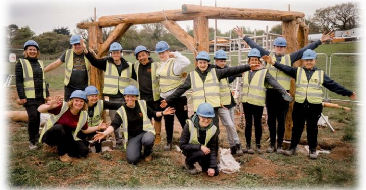
Prosiect Down to Earth yn Ysbyty Llandochau