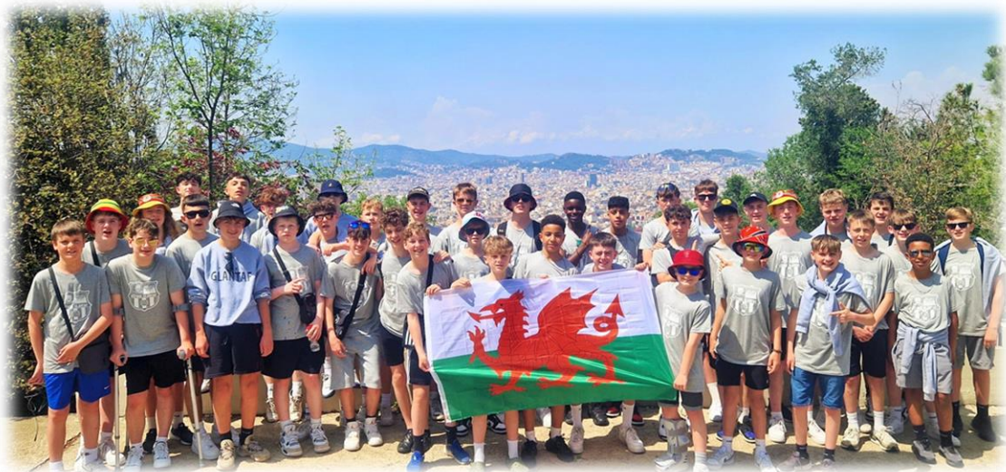
Sgwad Pêl-droed B19 ar daith Barcelona

Mae copi o galendr yr ysgol ar gael i rieni yn flynyddol o fis Medi neu drwy brif swyddfa'r ysgol ar 029 20 333090