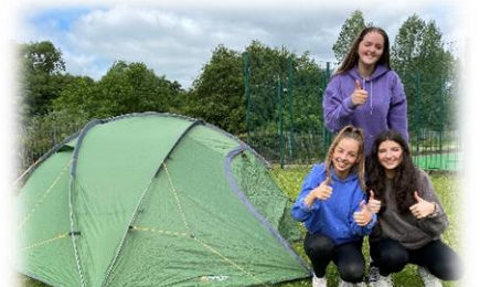
Paratoi am alldaith Dug Caeredin