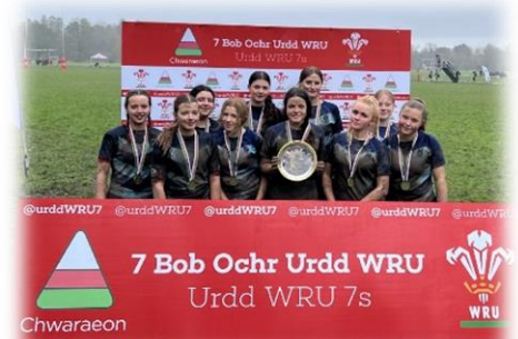
Enillwyr Plât Merched dan 15 Urdd 7 bob ochr

Rydym bob amser yn falch iawn o glywed am lwyddiant a datblygiad ein disgyblion, felly parhewch i rannu eich llwyddiannau gyda ni fel ysgol a'n hymddiheuriadau os oes rhai ar goll o'r rhestr uchod.