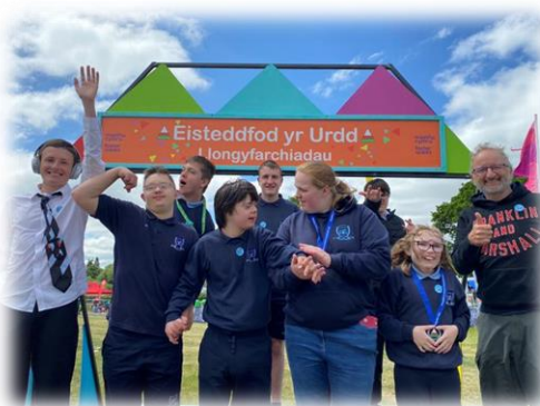
Cystadlu yn Eisteddfod yr Urdd.