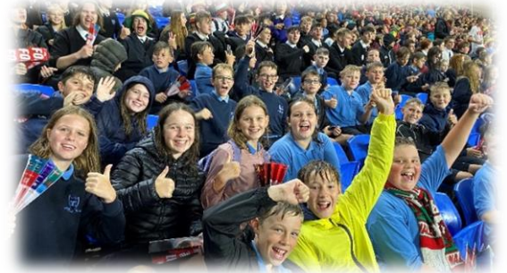
Cefnogi Cymru! Medi 2023

Rydym yn parhau gyda noson ychwanegol i rieni gyda ffocws fugeiliol gyda'r Tiwtor Personol. Rydym wedi parhau â chylchlythyr bob pythefnos i rieni sydd hefyd ar ein cyfrif Trydar @Ysgol_Glantaf ac ar ein gwefan www.glantaf.cymru Er mwyn gwella cyfathrebu, rydym wedi symud at lwyfan cyfathrebu Classcharts er mwyn rhannu gwybodaeth am gynnydd a phresenoldeb disgyblion yn fwy effeithiol. Cyfrannodd rhieni hefyd at ein harolwg ar ddarpariaeth lles.