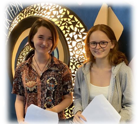
Dathliadau Safon Uwch B113 Awst 2022