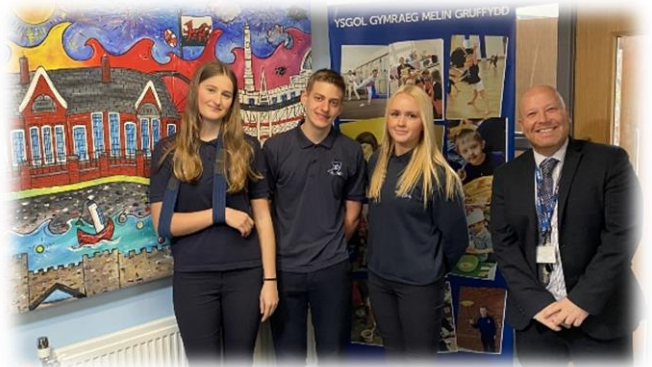
Pontio Cynradd, ymweliad â Melin Gruffudd

Yn ystod y Tymor yr Haf, cwblhaodd holl ddisgyblion Glantaf holiaduron a gyfrannodd at Awdit ysgol gyfan ar Les. Roedd yr awdit hwn hefyd yn cynnwys ceisio barn staff a rhieni ar ein darpariaeth bresennol. Rydym wedi derbyn dros 1,000 o ymatebion, sy'n cael eu casglu ar hyn o bryd a'u dadansoddi gan weithgor staff a gweithgor myfyrwyr. Bydd yr ymatebion hyn yn cael eu casglu a'u cynnwys yn ein Cynllun Gwella.