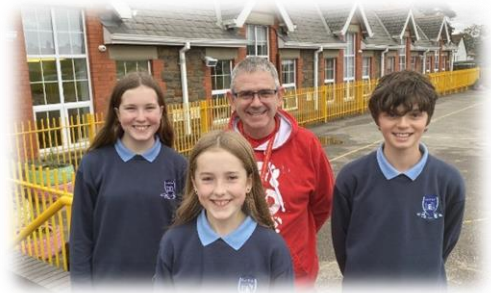
Ymweliad Pontio BI7 ag Ysgol Pencae

Nodyn i'ch atgoffa hefyd bod yr ysgol yn parhau â'n gwasanaeth ailgylchu rhad ac am ddim gan gynnig gwisg o ansawdd da i unrhyw deuluoedd sydd angen eitemau o wisg ysgol. I roi neu fanteisio ar y cynnig hwn, cysylltwch â'n tudalen Facebook / derbynfa'r ysgol. Roeddem hefyd yn hynod ddiolchgar am y cyfraniadau caredig tuag at ein Dawns Ffarwel i BI11 a BI13 a alluogodd ni i gefnogi myfyrwyr i ymuno yn eu dathliad diwedd blwyddyn.