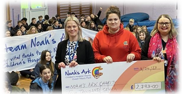
BI 8 Cefnogaeth wych i Apêl Arch Noa

Teithiau cerdded nodedig: Myfyrwyr Chweched Dosbarth i Castell Coch Elusen Oasis; Taith gerdded nodedig BI 9 er budd Ysbyty Felindre a Taith gerdded nodedig BI10 i gynorthwyo'r elusen Jac Bach . Tawelwch nawdd a thaith cerdded BI8 i Apêl Arch Noa, Ysbyty Plant Cymru.